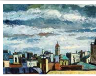
Миљивој Олујић, Панорама Београда