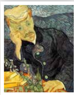
Винсент ван Гог, Портрет доктора Гашеа

Пред тобом су два портрета. Ван Гог је насликао портрет свог пријатеља, доктора Гашеа, док је Енгр портретисао господина Бертена, власника утицајног париског часописа. Др Гаше делује замишљено и сетно. Господин Бертен је енергична и самоуверена особа. Иако су на обе слике ликови врло изражајни, о њиховом карактеру нам много говоре и њихов положај на слици, колорит, пропорције и други елементи композиције.